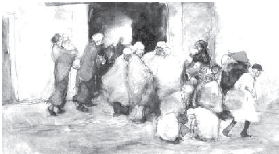
George Hendrik Breitner: Ingenkonyha (1882) Collection Stedelijk Museum Amsterdam

Ez a sokféle jelentős különbség elsősorban abból a szelekciós mechanizmusból adódhat, ahogy az intézmények kiválogatják ügyfeleiket, specializálódnak bizonyos célcsoportokra, de adódhat a napi rezsimből is, mikor lehet – nem lehet benntartózkodni az intézményben, vagy adódhat abból is, hogy együttműködik-e egy éjjeli és egy nappali intézmény stb. Az igazi kérdés az, hogy vajon ezek az ellátás-szervezési tényezők szervezik-e így vagy úgy a hajlék nélküli emberek mindennapi életmódját, mozgásait, vagy „fordítva”, a különböző ellátás-szervezési megoldások éppen a differenciált életmóddal rendelkező hajléktalan alcsoportok igényeit próbálják-e megfelelő módon kiszolgálni. Azt feltételezzük, hogy egy részletesebb vizsgálat esetén erre is és arra is találnánk példát.