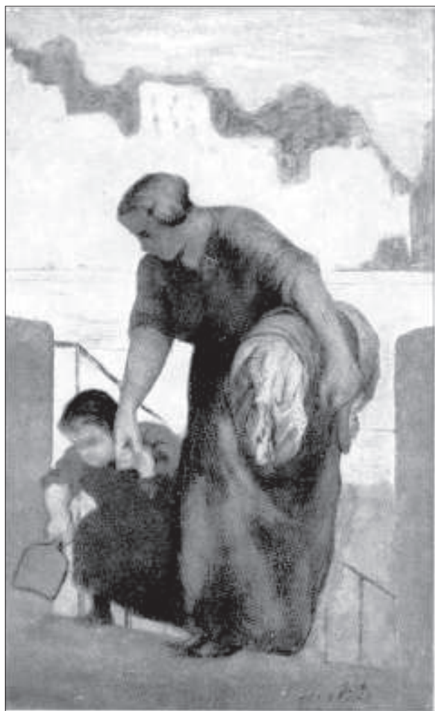
Daumier: Mosónő Louvre, Paris

A másik oldalról nézve ez azt is jelenti, hogy az 1999-ben megkérdezett 2500 ember közül 2200 fő (88%) nincs ott 2004. február 3-án az intézményes ellátást igénybe vevők között, a 2000-ben megkérdezettek körében ez az arány 89% (2001: 84%, 2002: 76%, 2003: 73%). Egy részük egy ideig igénybe vette az ellátást, majd innen végleg kikerülve folytatja útját a bizonytalan lakhatás világában (vagy egy tartós bentlakásos intézményben), egy részükkel azonban még találkozhatunk a következő években ismét a hajléktalan ellátás igénybe vevőjeként.