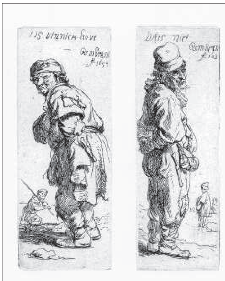
Rembrandt: Baromi hideg van (1634)