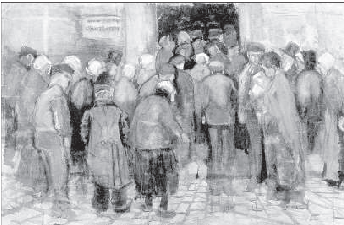
Vincent van Gogh: A szegény(ek) és a pénz (1882) Van Gogh Museum, Amsterdam

Ha a megkérdezett hajlék nélküli emberek teljes körét tekintjük, akkor a nyolc óra munka helyett három és fél óra munkát találunk, a nyolc óra pihenés (alvás) megvan, a nyolc óra szórakozás helyett 1,4 óra szórakozás, 1,7 óra TV-nézés, 2,2 óra tisztálkodás-evés-ivás és 3,9 óra sorban állás-ügyintézés-közlekedés jut osztályrészül.