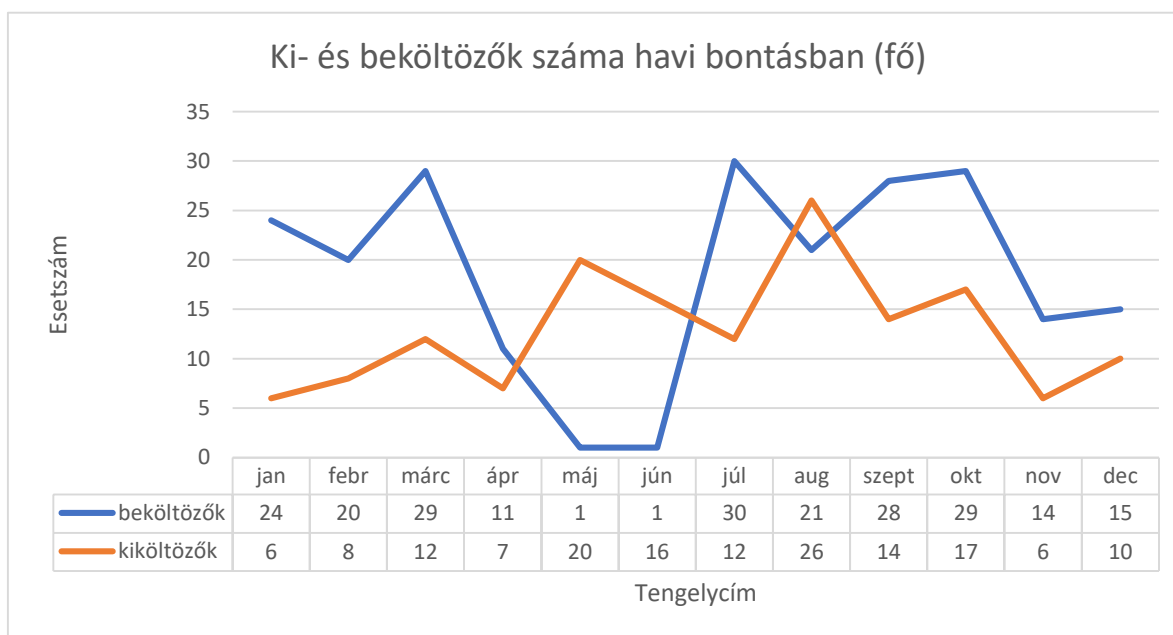
4. táblázat: Ki- és Beköltözők 2020-ban