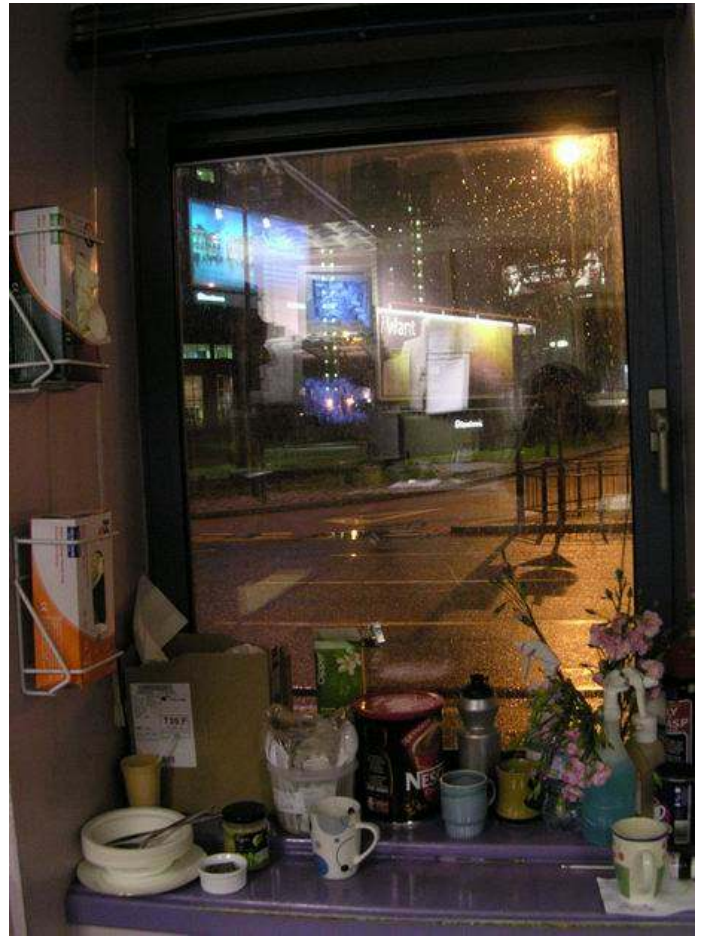
Kilátás az ügyeletről a főútra

A szociknak is jó, mert nem mindent vezet senki be a naplóba, de jó, ha szóban meg van említve a következő kolléga számára.