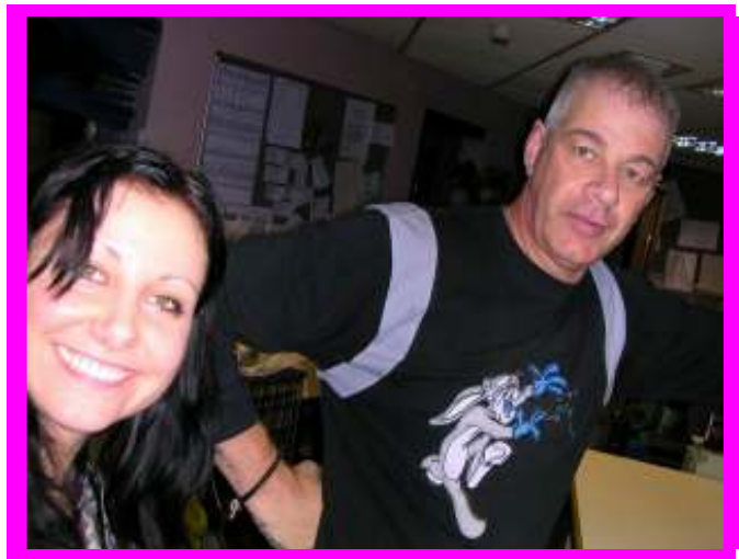
Martinnal aki hamarosan feltűnik majd a magyar szállókon... ☺

Persze akármilyen jó és toleráns hely is a Graham house, a végtelenségig nem maradhatnak itt a lakók, úgyhogy az alatt a 2 év alatt, amit itt töltenek, a szocik igyekszik őket felkészíteni az önálló életre. Beadják szépen a lakásigényléseket, amire persze rengeteget kell várni, de nem olyan lottónyereménnyel egyenlő esélyű, mint nálunk. Vannak olyan projektek, akik ún. fél-független lakásokat tartanak fent. A szoci ugyanúgy kijár és utógondozza, és minden erővel próbálja kint tartani.