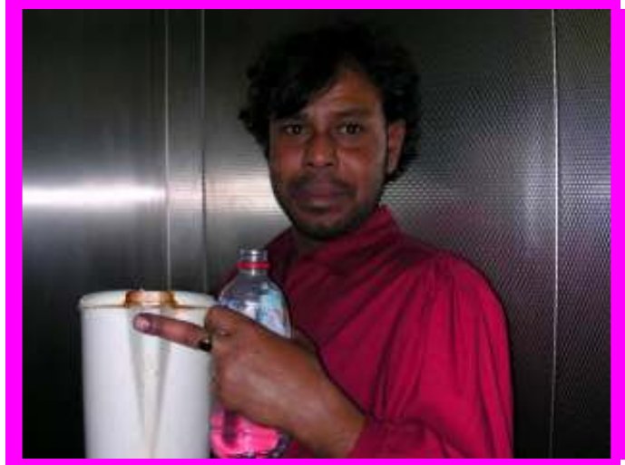
A szálló primadonnája ©

De ilyen finomságok vannak itt a londoni listába, ami nálunk nincs: - Írd be a lakó születésnapját az ügyeleti naptárba stb.. stb... Aki kíváncsi ezekre a protokoll listákra, hazaérkezésemkor a kész mappába megtalálható lesz majd.