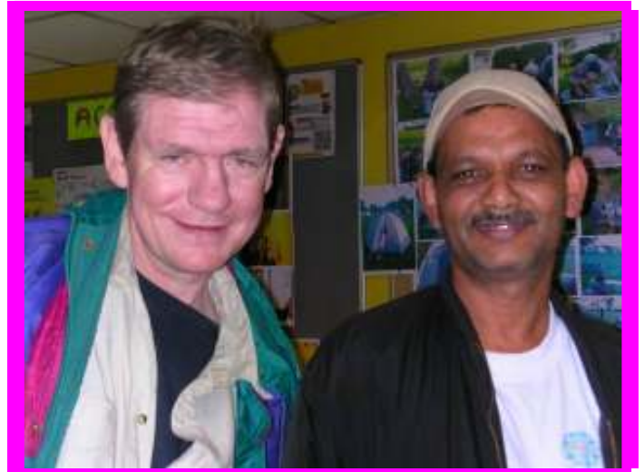
Az este képzőművészei

Szokott nekik különböző tréningeket tartani pld. a különböző nehéz személyiségekkel való együttműködés titkairól... és hát a szállón ugye van elég nehéz személyiség. Előfordul, hogy az önkénteseket megbántják, előfordul az is hogy agresszívak velük. Ilyenkor általában ezek a segítők már a legközelebbi alkalommal nem jönnek többé. Hát esti műszakomon én is pont kifogtam, hogy nem jöttek az önkéntesek a képzőművészeti csoportra.