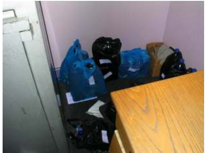
Napi italmennyiség a pult mögött. Innen adják ki a lakóknak a megegyezett mennyiségben.

Hát, íme egy kis etűd a szociális munka örömeiből ☺. A szobákat a lakóknak kell takarítani, de vannak olyan pszichiátriai betegek, akik még maguk higiéniai állapotáért sem igen képesek felelősséget vállalni, ilyenkor a takarító személyzet kicsit besegít nekik.