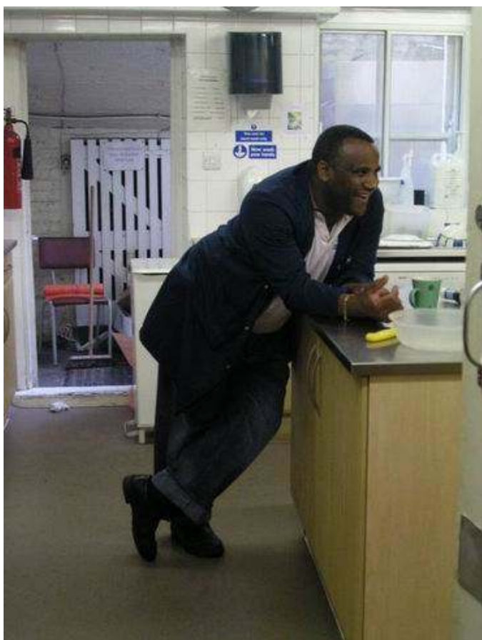
A takarítónk...épp nagyon elfoglalt... ©