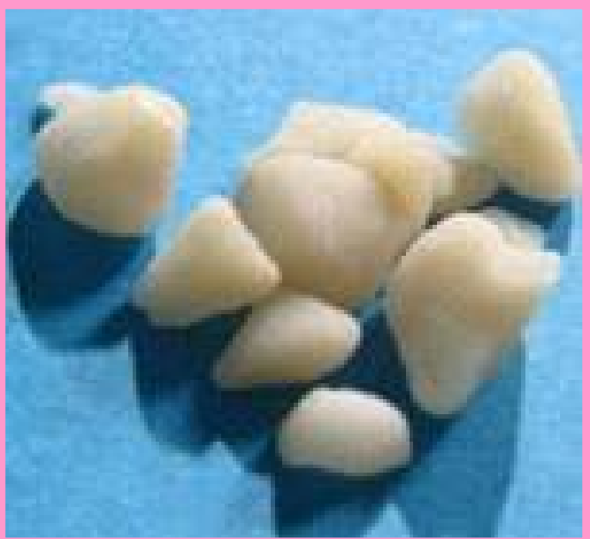
London elsőszámú kedvence a krek kókain

szerzeményével, a térdéig lehúzódó gombás fertőzésével. Hogy maradandó élményben részesüljünk, jól meg is vakargatja magát. Az itteni hölgyek – azon kívül, hogy mindegyikük prostituált – erőteljes droghasználók, egy részük Hepatitis és HIV fertőzött. Többségük valamilyen hajléktalanszálló lakója, csak igen kevesen élnek albérletben.