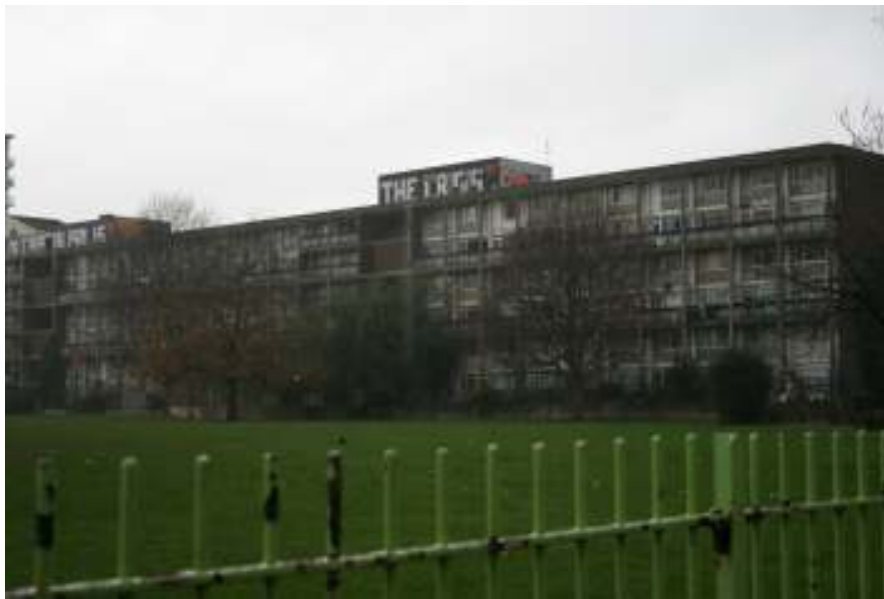
A Cottal Street squatter-házsora hátulról.

Visszatérve a híd alá: kénytelen voltam belátni, hogy az eső nem fog elállni, és elindultam egy a Cottal Streetre merőleges utcán, amelyről egy kis gyaloglás után a squatter-házsor hátuljára lehetett rálátni. Itt be tudtam állni egy buszmegálló esővédő teteje alá, és végre készíthettem néhány fotót.