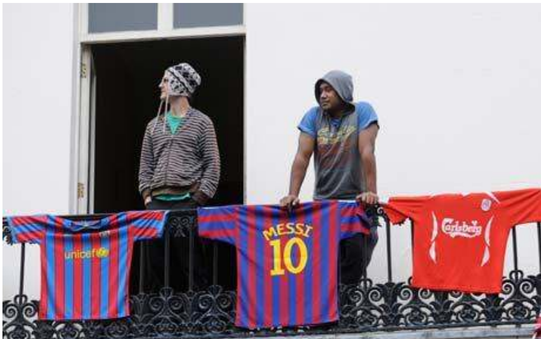
(Squatterek egy luxuspalota erkélyén)

A hírt kommentek is kísérték: a hozzászólók megosztottak, legtöbbször nem pontosan értik, hogyan lehet ezt megtenni és elég sokan elmagyarázzák, hogy ez miért és hogyan lehet jogszerű. Legtöbbször nem értenek egyet a squatterekkel, de néhány hozzászóló igen. Egy arizonai férfi – aki korábban maga is volt londoni squatter – szerint ezek csak szenteskedő alakok, ha az ő házával próbálkoznának – írja - ő biz’ a pisztolyával támasztaná alá a véleményét, mely szerint kívül tágasabb.