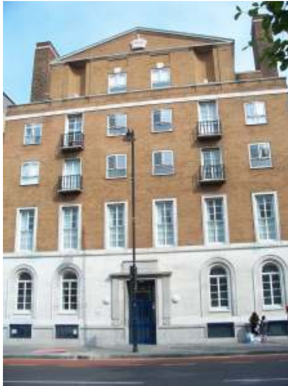
A felújított Mare utca szálló

Az Intézmény Hackney város negyedben található és a főváros támogatása által lett felújítva 1996-ban.